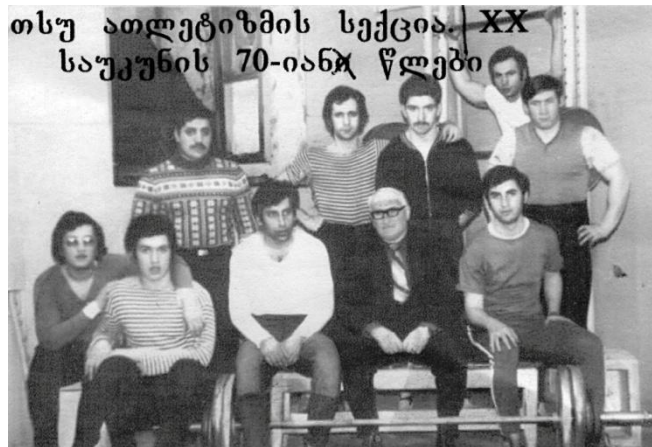
თსუ-ს ათლეტიზმის სექცია XX საუკუნის 70-იან წლებში

ლ. ბერია ძალოსნებს ხშირად ორაზროვნად აფრთხილებდა: “უცხოეთში ტურნირებზე ვერ წახვალთ, მაგრამ მათ შედეგებით მაინც უნდა აჯობოთო”.